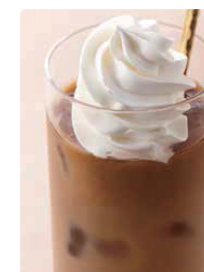
アイスカフェ オーレ